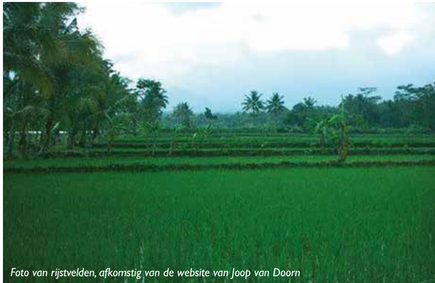
Foto van rijstvelden

Leven, je moet het zelf doen. Het is donker, zo stil, het regent zacht. Een klein gestameld gebedje